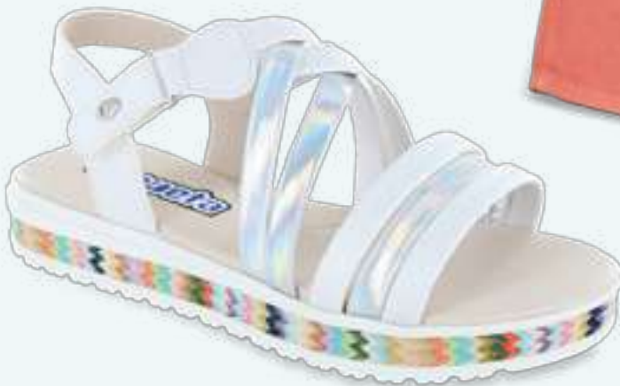
112313-B COLOR: BLANCO TALLAS: 18 A 21 ENTEROS CÓDIGO: 134-006