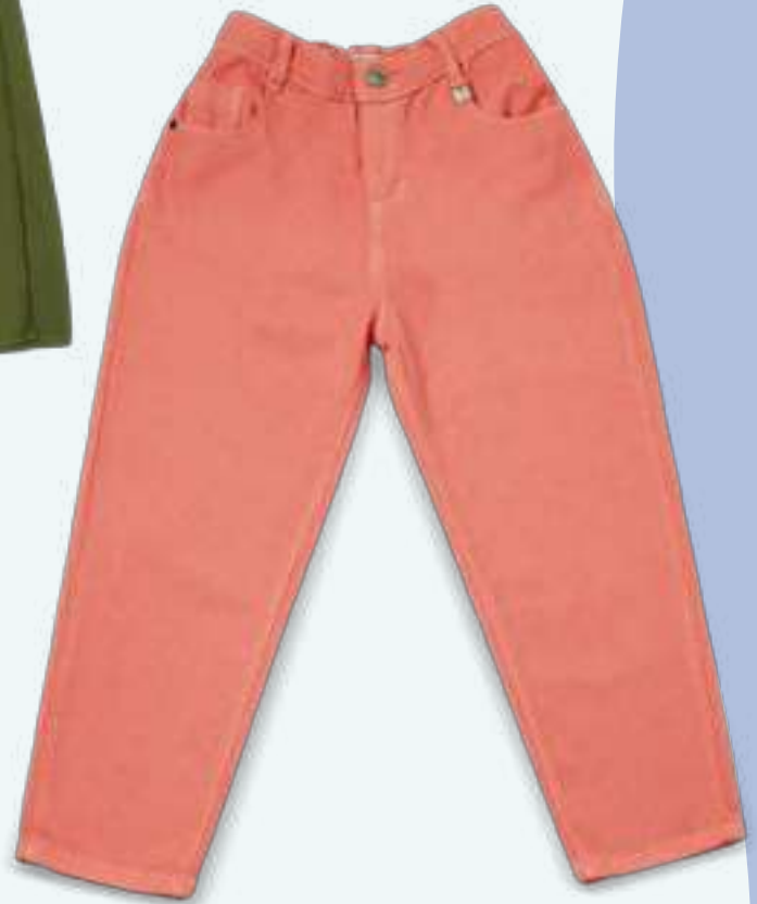
11642-I PANTALÓN COLOR: ROSA 100% ALGODÓN TALLAS: 10 A 12 CÓDIGO: 122-273