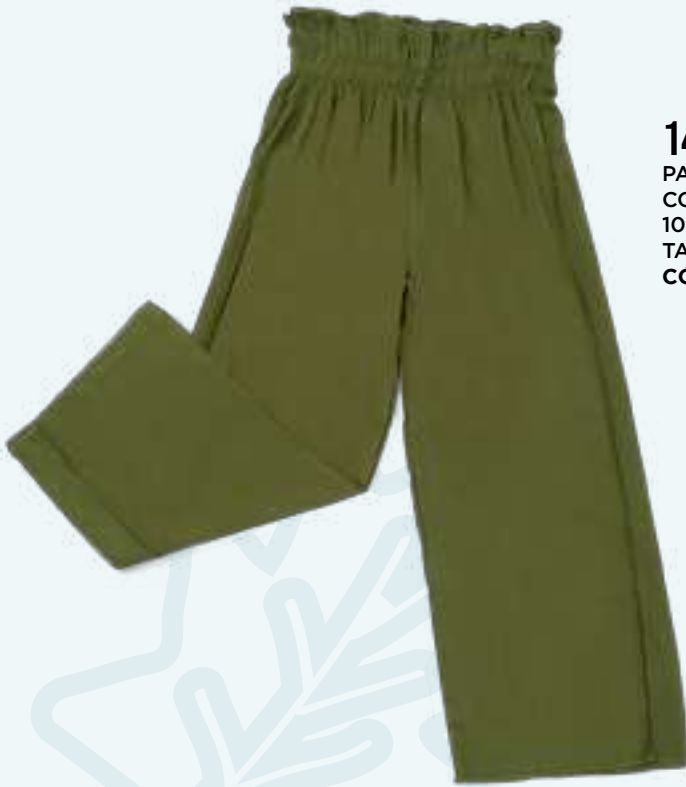
14001-P PANTALÓN COLOR: VERDE 100% ALGODÓN TALLAS: 6 A 10 CÓDIGO: 143-350